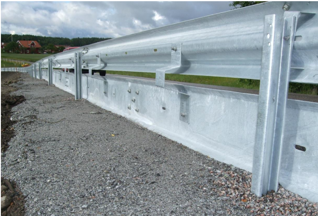
Foton ovan tagna efter installationen 25 juni 2012.