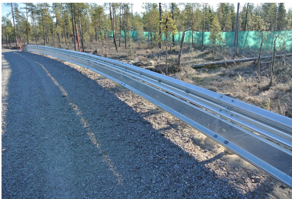
Inspektion oktober 2013.