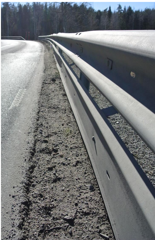
MPS-skyddet deformerat och den typiska ”vågformen” synlig på W-profilen.