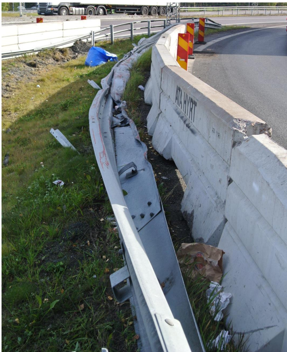
Foto från den första större påkörningen som inträffade redan på hösten 2013.

Under de tre åren av uppföljning har 3 större reparationer genomförts (den senaste i Ljungarum ej medräknad). Flera mindre påkörningar som inte medfört reparation har också noterats. Ljungarum står ut som betydligt mer skadedrabbad än övriga platser.