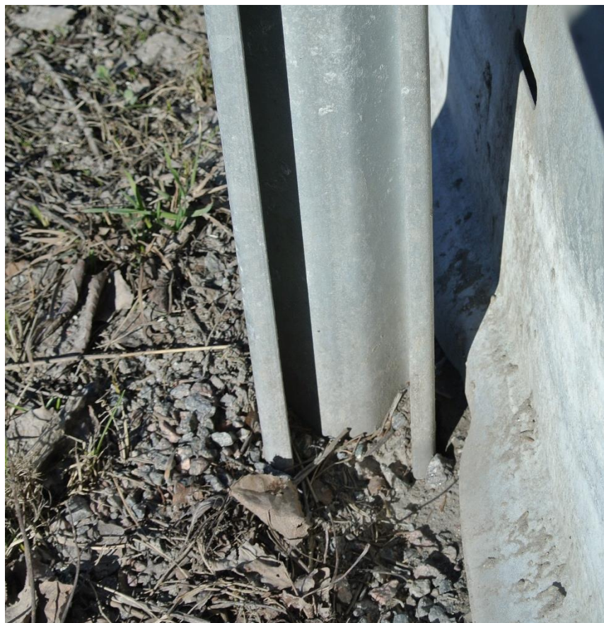
En vanligare typ av deformation som observerats på flera ställen och för olika MPS, plåten trycks mot stolpen i nederkant och en lokal buckling uppkommer.