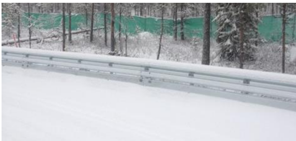
Efter installationen i november 2012.