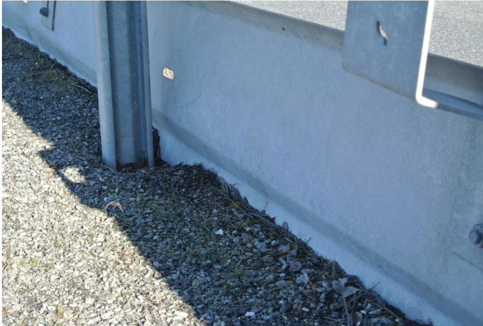
Deformationen sedd från baksidan.