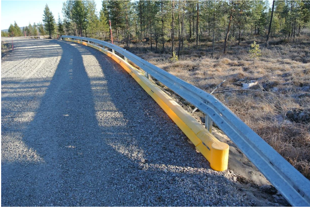
Inspektion oktober 2013.