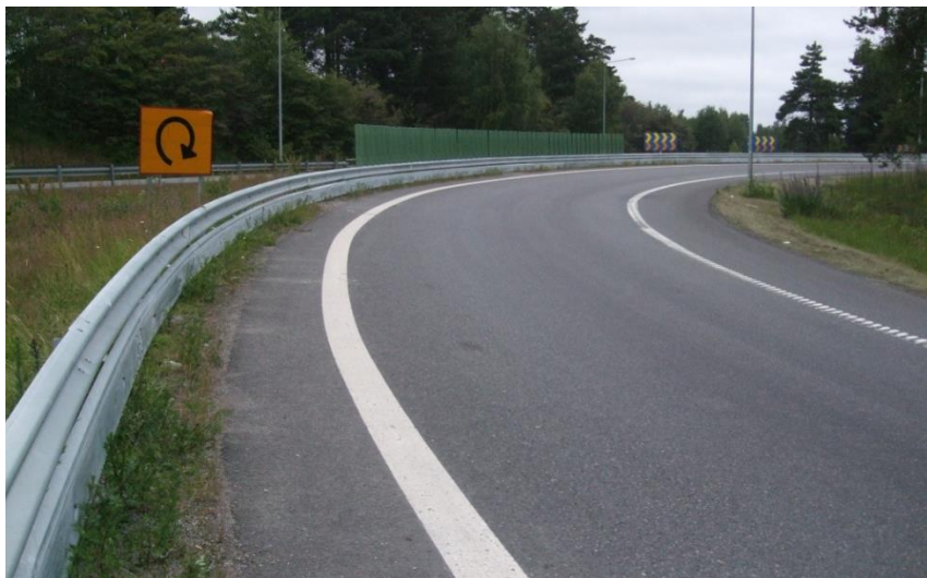
Jönköping, Ljungarum E4