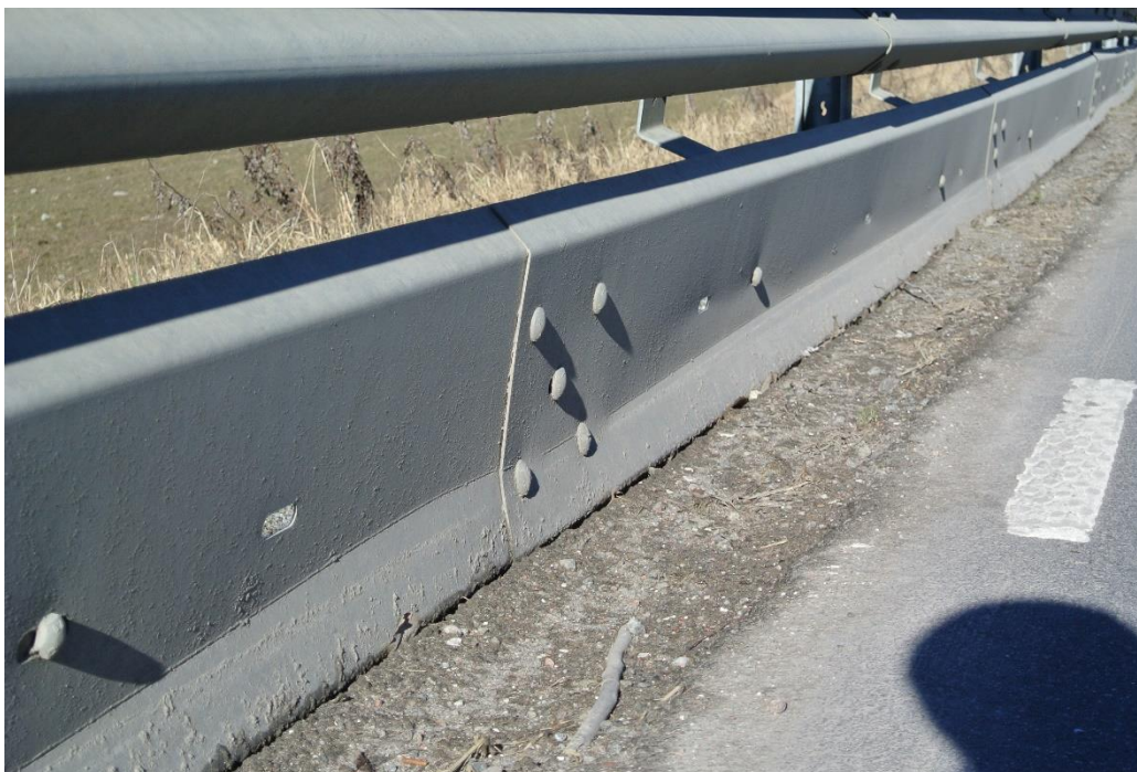
Deformationen i MPS-skyddets nederkant syns tydligt på trafiksidan.