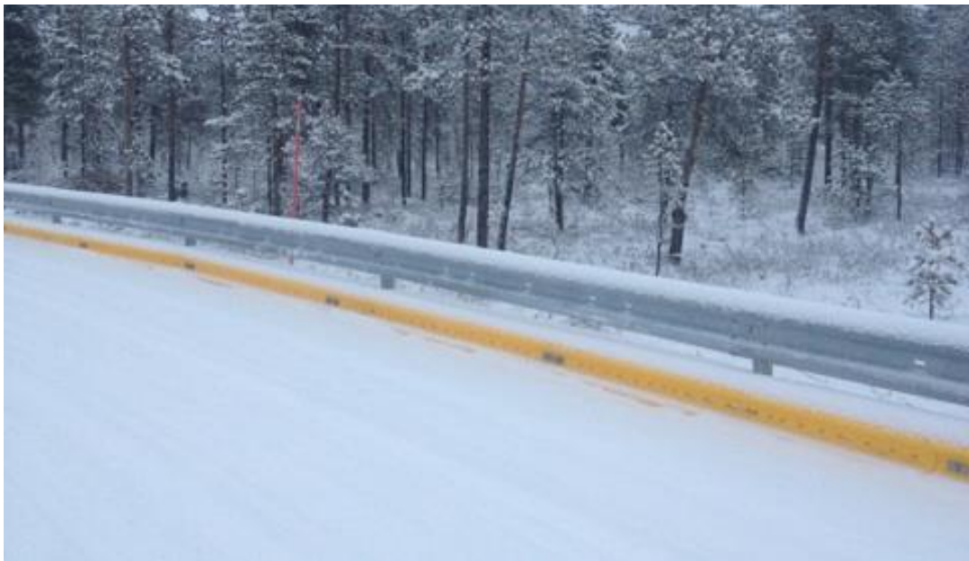
Efter installationen i november 2012.