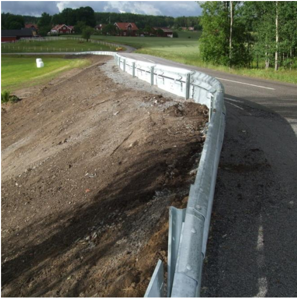
Botkyrka, väg 257