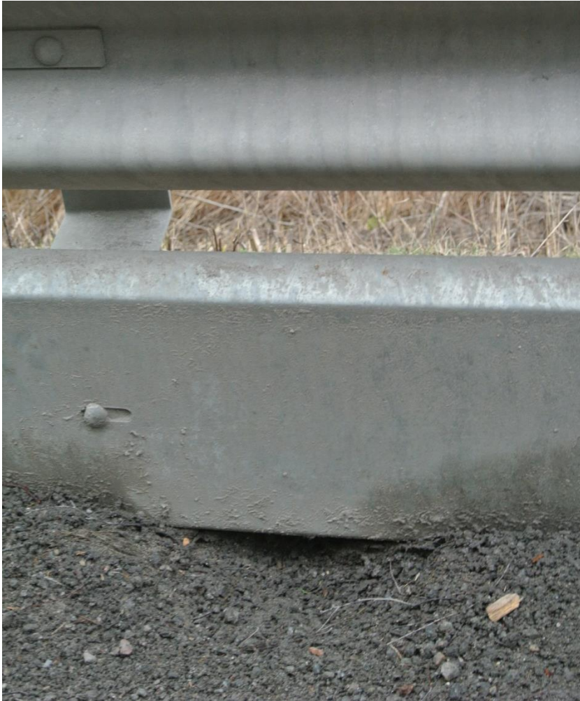
Foto från Botkyrka som visar grusupbyggnaden mot MPS-plåtens nederdel.

Vattenavrinningen från vägbanan försvåras också. I Botkyrka noterades detta redan efter första säsongen men det tycks inte ha förvärrats nämnvärt påföljande 2 år. Se exempel på erosionens utveckling nedan.