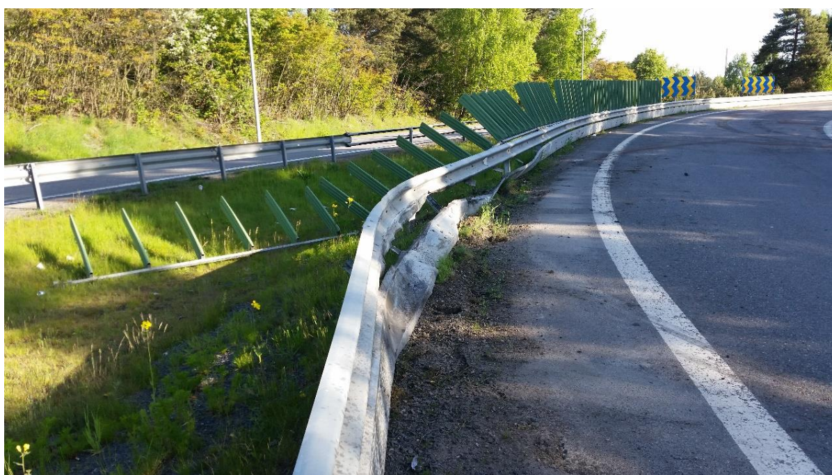
Foton från påkörningen i Ljungarum i maj 2015.

Även i Botkyrka inträffade en större påkörning i februari 2014 (som reparerades) MPS-skydden återanvändes denna gång i testinstallationen trots att de var deformerade. Bildexempel nedan.