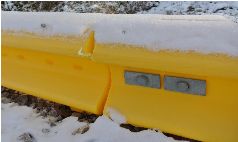
Exempel på de skrapmärken i plasten som förekom på några ställen.